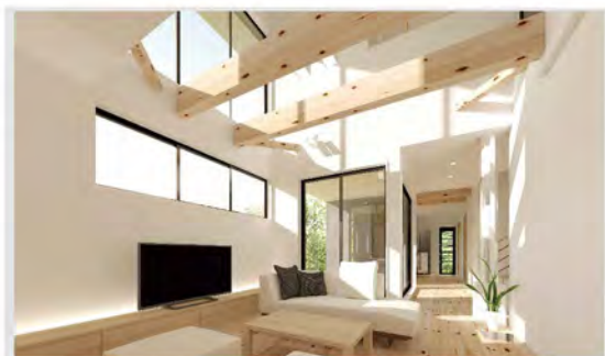
自然と光が差し込んで、家族が集まりたくなるLDKです。