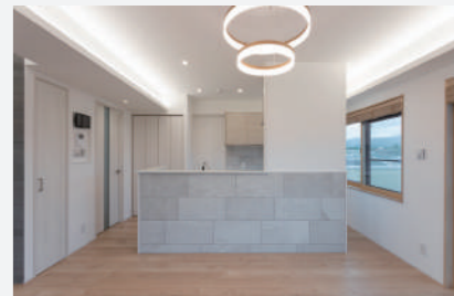
光のラインと個性的なペンダントの効いた照明計画キッチン周囲に貼ったタイルはテーブルがぶつかりやすい部分に強度を担保しながら、空間のグレード感を高めるアクセントとしても効いています。