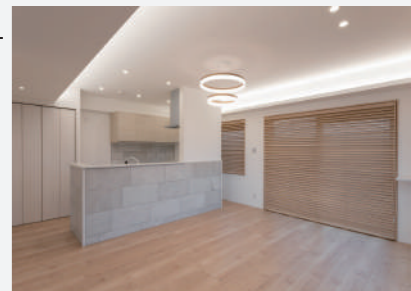
ブラインドを落とすと、フロアと照明、窓枠とブラインドオーソドックスに整えられたカラーリングの効果が際立ちます。