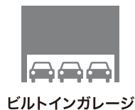
ビルトインガレージ